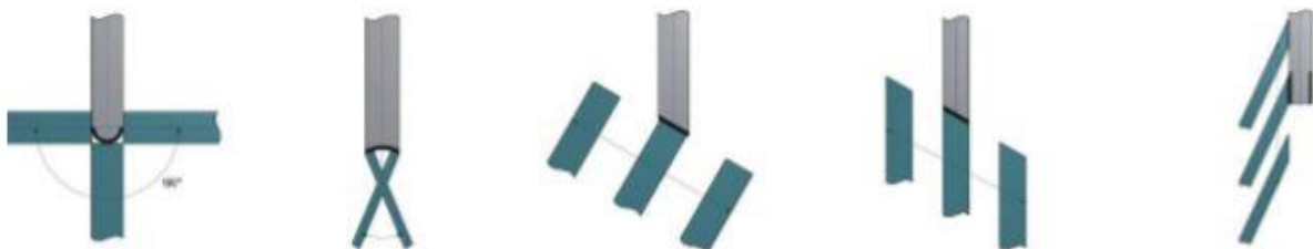
Rysunek 2. Rodzaje obrabianych kształtów